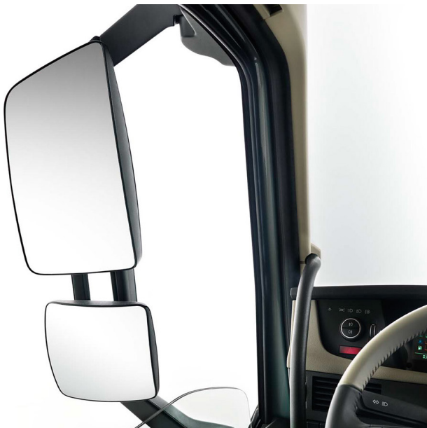
Ausgezeichnete Sicht nach hinten.